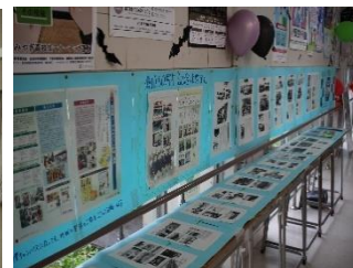
50周年記念コーナークラス