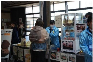
栗原青年文化祭にて出展販売