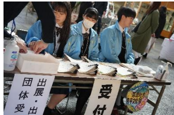
青年文化祭で受付作業