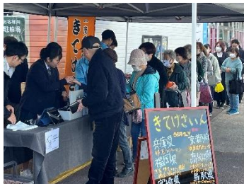
スーパーアークス前では長蛇の列