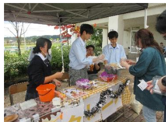
各模擬店の豊富なメニュー