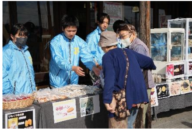
あやめの里前でお客様へ商品紹介