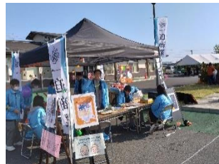
いちばさまハロウィンマルシェにて催しや運営ボランティア