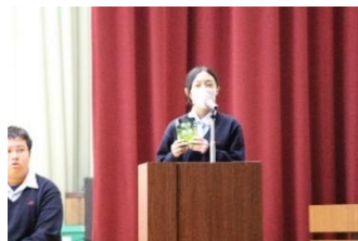
ピピリオバトル決勝

10月18・19日令和6年度の石楠花祭(文化祭)が開催されました。18日(金)は校内発表。多彩な企画で驚きと笑いの日でした。19日(土)は一般公開。ご家族・友人・地域の方々など多くの方に来場いただきました。今年度は一迫商業高校として全校が揃う最後の年となります。一商の魅力は伝わったでしょうか。