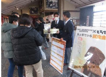
新商品企画「チョコ米ていら(仮)」試食会！ 将来の自分のために実習中