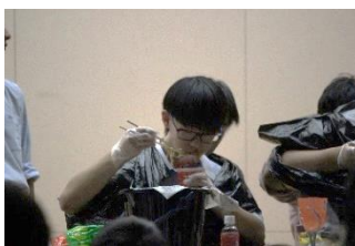
クラス対抗二人羽織