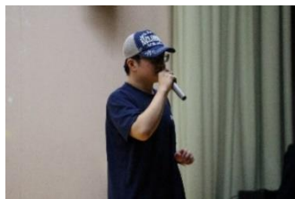
ヴォイスパーカッション披露