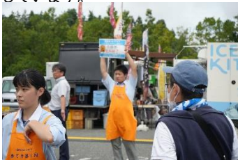
栗原市民まつりで誘導案内係

地域に必要とされる 地域の学校として、またコミュニケーションの育成を目的に本校は今年度も地域のイベントに積極的に参加しています。