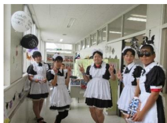
突然出現した一商ガールズ