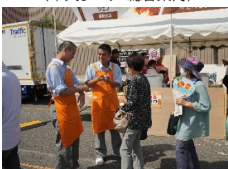
(市民まつり カレー振るまい)