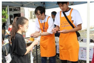
(夜市 オリジナル缶バッジの配布)