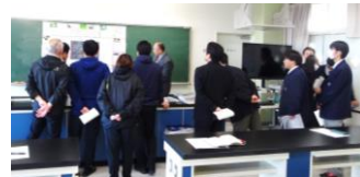
感想をもらいました