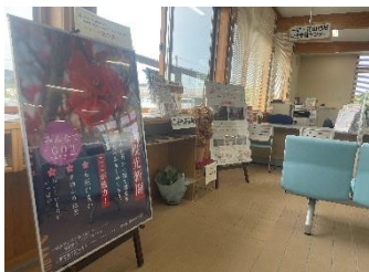
観光ポスター「一迫の春」を一迫総合支所に

生徒が制作したポスターをB1サイズにて市内各所で展示されています。ご覧ください。