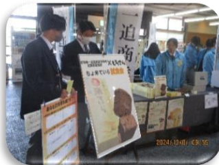
起業家教育(新商品調査中)