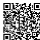
一迫商業ホームページ