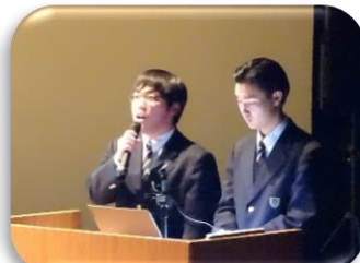
デュアルシステム学習報告会