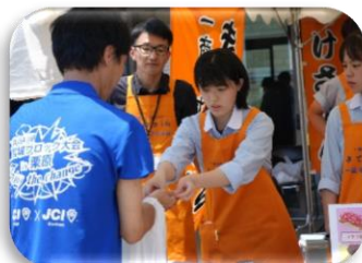
販売実習(丁寧な接客を列で販売中)