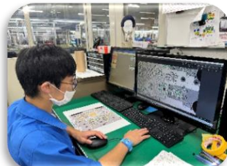
企業実習(長期実習中)