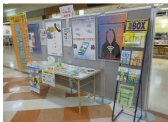
消費者啓発ポスターをイオン志波姫店に