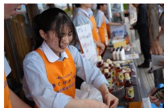
はじめての販売に緊張 お客様よりお声がけいただき感謝 栗原では販売していない商品が人気

デュアルシステムのなかの『販売実習』。定例販売は年2回開店し、6月に第1回目を一迫のあやめの里さま店頭を会場に実施しました。今年度は「大船渡市山林火災復興応援企画」として大船渡市の商品を買って応援、売って応援。仕入れから決算まですべてを生徒自身が行います。今回は「あやめまつり」と日程が重なり多くのお客様に来店いただきました。収益金は年度末に大船渡市へ復興支援として寄付する予定です。第2回目は11月に築館のアークスさま店頭で開催します。また、地域イベントにも参加しています。次回販売は8月30日(土)栗原市民まつりです。