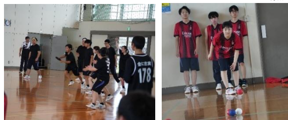
新種目 ドッジビー(左)とボッチャ(右) どちらも盛り上がりました

スポーツフェスティバルは種目から一新。昨年度までの大縄跳び、バスケットボール、ドッジボール、サッカーに加え、新種目「ボッチャ、スポーツ鬼ごっこ、障害物リレー、ドッジビー」を導入。誰でも楽しみながら挑戦できるイベントとなり、学年対抗戦は大いに盛り上がった2日間でした。