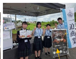
生徒自作ポスター