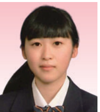
株式会社七十七銀行