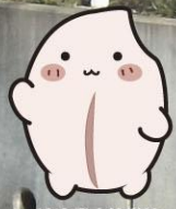
一迫商業高等学校 マスコットキャラクター こめたん